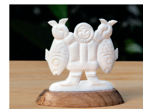
УЭЛЕНСКАЯ РЕЗНАЯ КОСТЬ