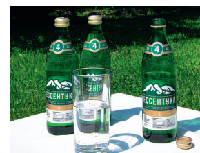
ЭССЕНТУКИ (МИНЕРАЛЬНАЯ ВОДА)