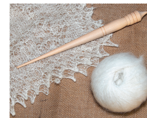
ОРЕНБУРГСКИЙ ПУХОВЫЙ ПЛАТОК