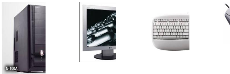
Рис. 1. Составные части компьютера.

8). Рисунки также имеют сквозную нумерацию, нумеруются (Рис. 1.) и подписываются внизу изображения. Например: